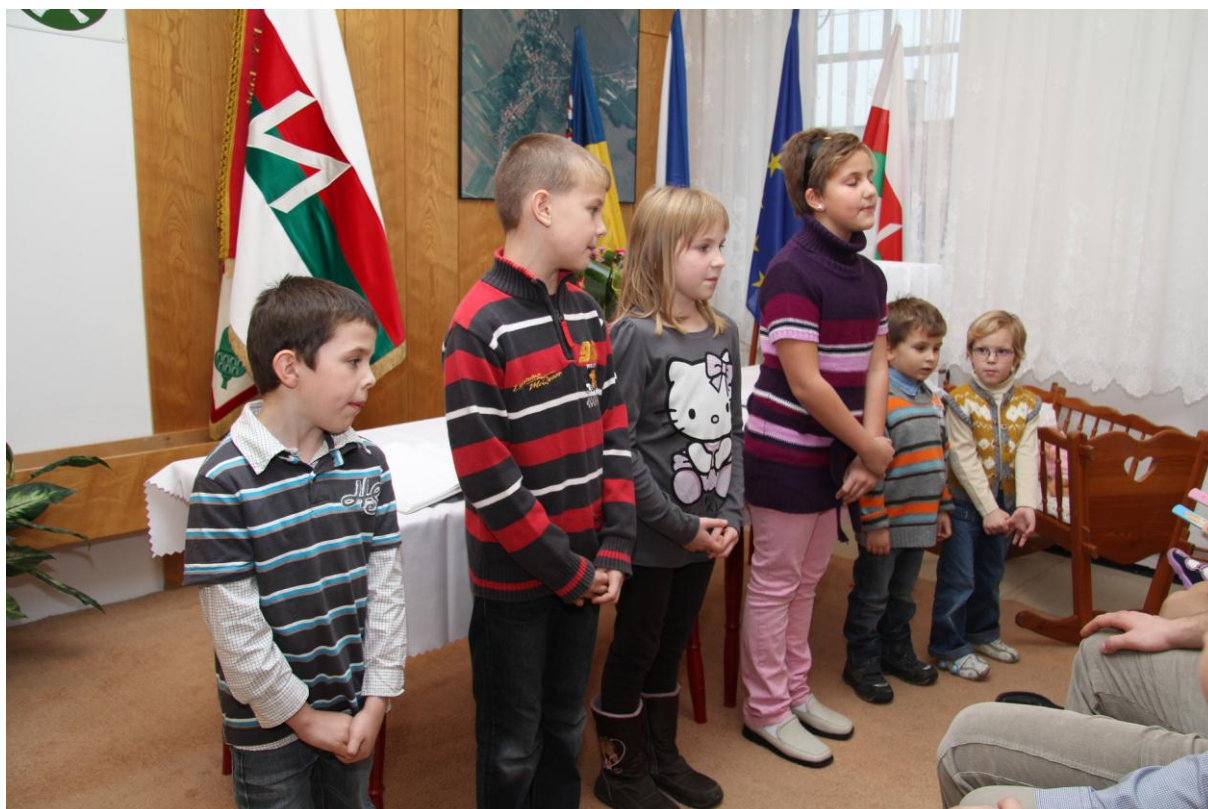
přednášející školáci a školkáčci