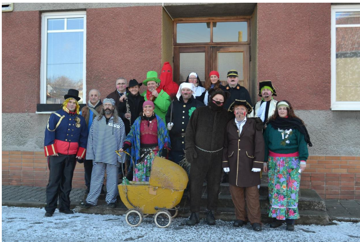
Medvěďářská družina – Končiny 2017