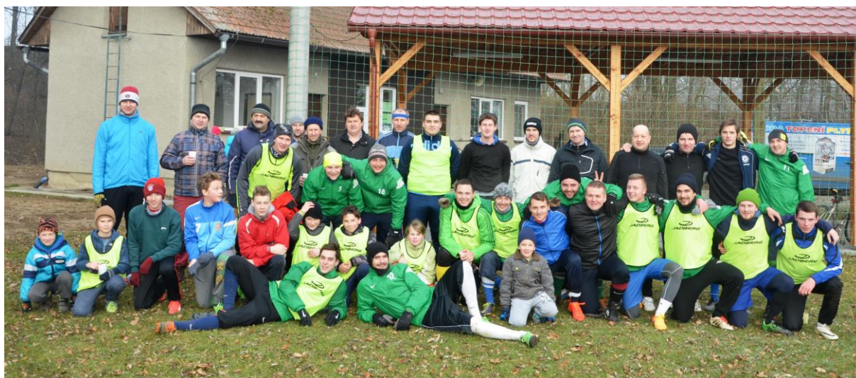
Silvestrovský fotbálek 31.12.2016

2.4.2017 15:00 Kladeruby – Janová (1. mistrovské utkání jara)