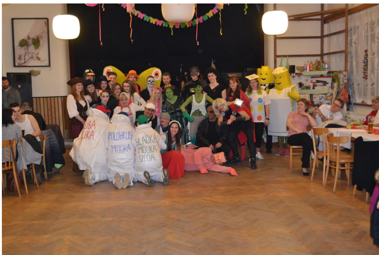
Masky na šibřinkové zábavě